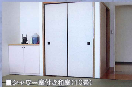
■シャワー室付き和室(10畳)

災害時の避難所として活用する場合を考え、震度7にも耐える耐震設計となっており、お年寄りや赤ちゃんのための休憩スペースとしてシャワー室付きの緊急対策室(和室)を男女用それぞれ設置しました。